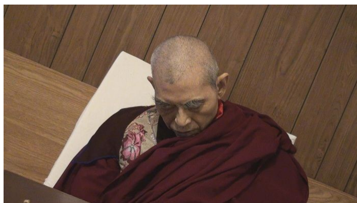
禄东赞法王生死自由，在预告的时间圆寂